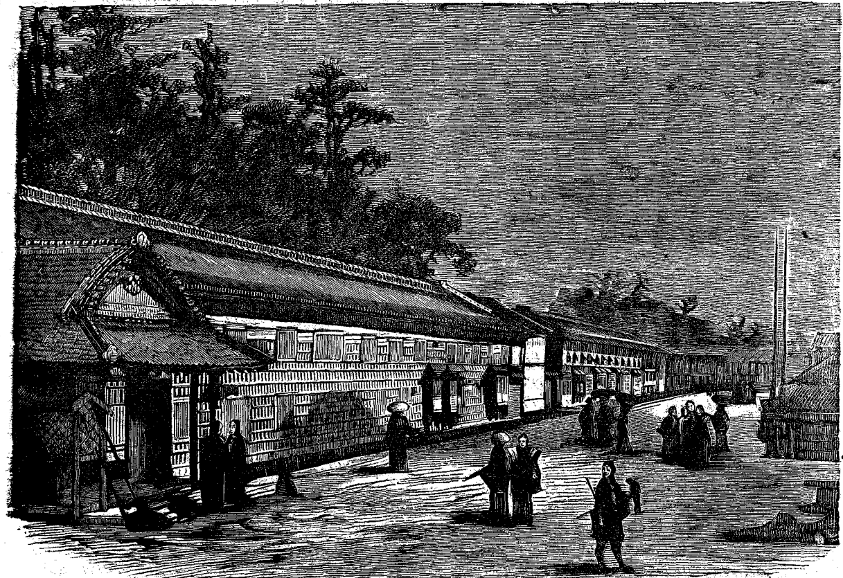
Ἐπαυλις ἐν Ἰαπωνίᾳ (1).

Ἄ Καὶ πάντες οἱ συγκεχυμένοι οὗτοι, ἤχοι, αἱ